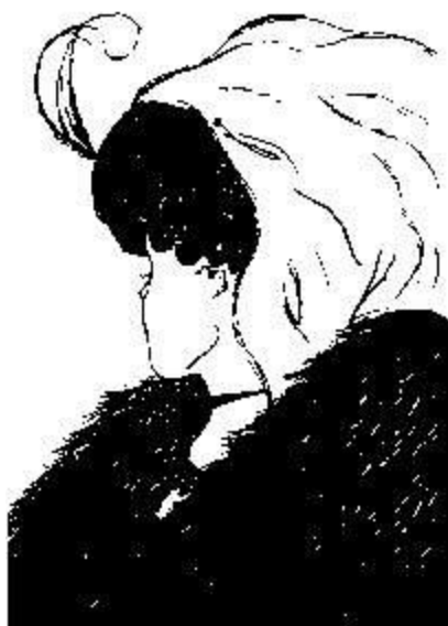
Une vieille ..... et une jeune .....

Je trouve l'analogie très révélatrice sur le problème du jeu compulsif aux appareils électroniques de jeux (AEJ). En associant nos pertes au visage de la dame âgée et nos gains au visage pourtant plus petit de la jeune, nous comprenons mieux l'illusion dont nous fumes victimes.